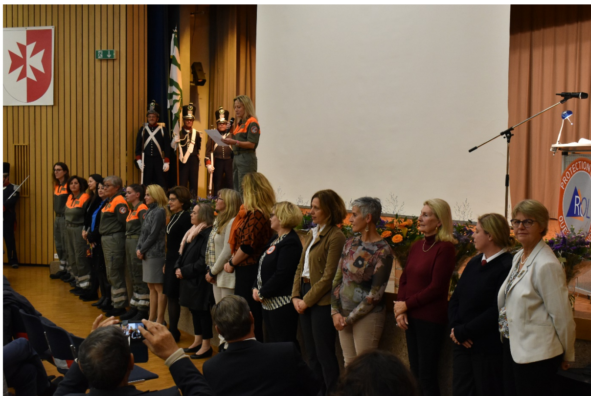
Rapport bataillonnaire de l'ORPC Ouest Lausannois – 22 novembre 2022 Hommage aux 22 Femmes qui oeuvrent ou ont œuvré pour la Protection de la population

Avec cette année riche en événements, en émotions et en informations, l'ORPC Ouest Lausannois, remercie toutes les personnes astreintes de son organisation pour leur engagement au sein de leur compagnie respective, toutes leurs implications à plusieurs reprises au cours de l'année écoulée. Nous remercions également les Partenaires du District Ouest lausannois pour leur soutien professionnel, les Organisations régionales de protection civile voisines pour leur engagement à nos côtés, et enfin, nos Autorités communales pour leur confiance témoignée et leurs encouragements.