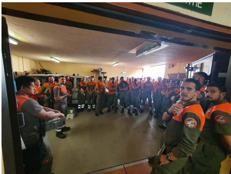
Compagnie I – Mars 2022 Premier service d'instruction sur la base d'une compagnie