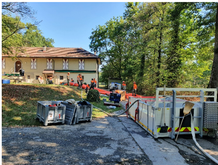
Entraînement sur le matériel Eléments naturels sur le site du refuge de Montassé, à Crissier

Lors de la journée inter domaines, les astreints ont pu actualiser des connaissances de base tel que l'utilisation de la radio et la gestion du trafic dans un carrefour avec l'appui de la police. Ils ont également manipulé des extincteurs pour leur permettre de gérer un éventuel départ d'incendie. Cette leçon s'est effectuée avec l'appui des sapeurs-pompiers. Pour finir, ils ont suivi une formation sur les bases du sanitaire avec le soutien d'un partenaire externe.