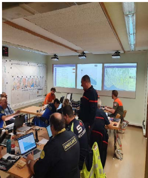
Salle de conduite du Poste de commandement régional réunissant les Partenaires de la Sécurité du District