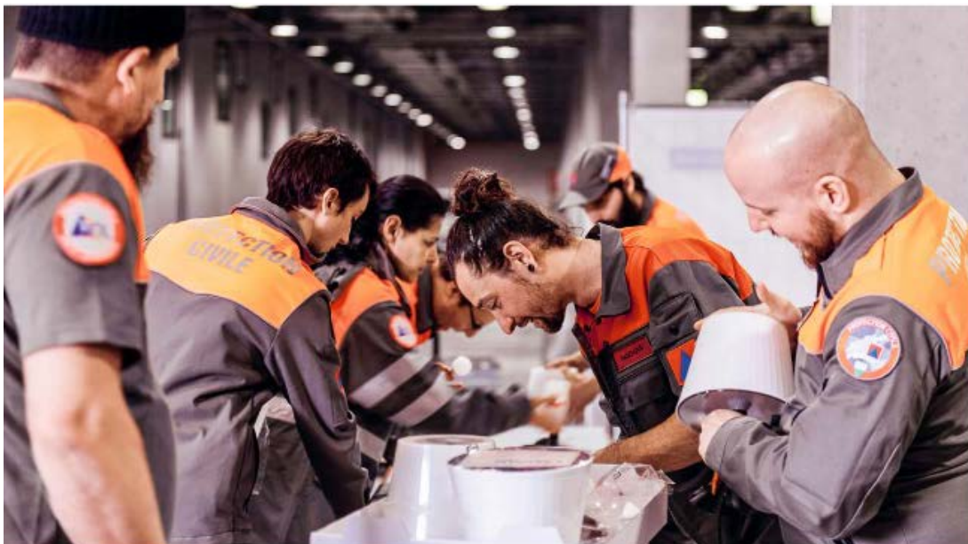
Afin de pouvoir garantir un accueil sur le long terme des réfugiés, la protection civile vaudoise a mis en place un hébergement d'urgence temporaire doté de 200 lits au Palais de Beaulieu à Lausanne. La protection civile est également chargée de son exploitation.

Saluons l'engagement particulier des personnes astreintes de l'ORPC Lausanne District et Ouest Lausannois, qui juste après les engagements des années Covid (2020-2021-janvier et février 2022), sont mobilisées à nouveau.